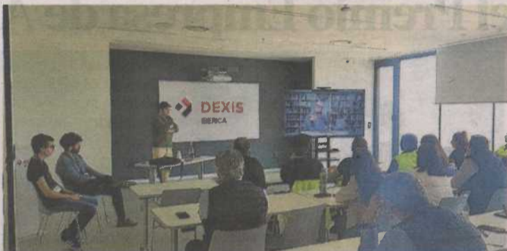
Las empresas también quieren este tipo de formación. ATADES

mente con un equipo multidisciplinar compuesto por un pedagogo, terapeutas ocupacionales, integradores sociales, psicólogos y responsables del servicio de voluntariado. Además, cuentan con el refuerzo de los usuarios de distintos centros de Atades. Todos ellos se sirven de materiales audiovisuales nuevos o adaptados para trabajar a través de talleres y sesiones lúdicas y formativas.