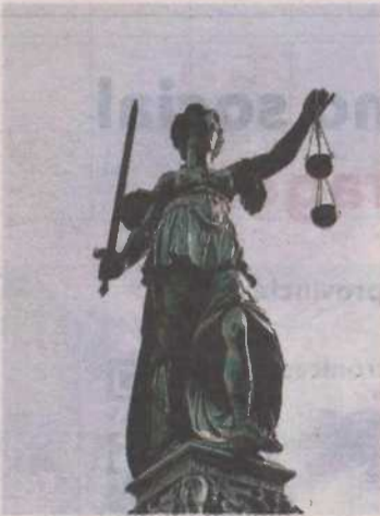
Representación de la Justicia.

«Tratamos de evaluar en qué medida existen leyes, políticas o prácticas (incluidas las prácticas prometedoras), que permitan a las personas con discapacidad intelectual o psicosocial acusadas