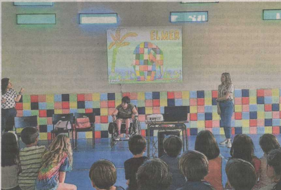
En las sesiones participan personas con discapacidad que cuentan su día a día. ATADES

En este sentido, Roldán asegura que cuando los profesionales de