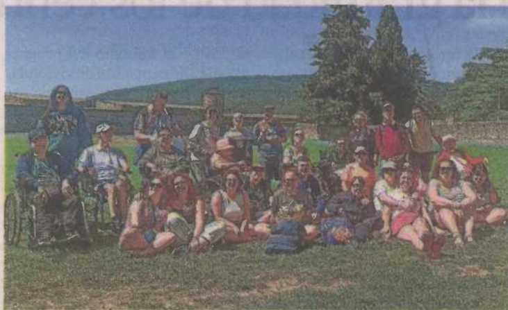
Uno de los grupos, en la Ciudadela de Jaca.

Para no faltar a la tradición, el Centro de Actividades Socioculturales de Fundación Dfa organizó un viaje vacacional dirigido a sus usuarios y usuarias. El destino elegido fue el Pirineo de Huesca, y el albergue de Pirenarium de Sabiñánigo se convirtió en el centro de operaciones de un viaje de cuatro días de convivencia marcado por el buen ambiente.