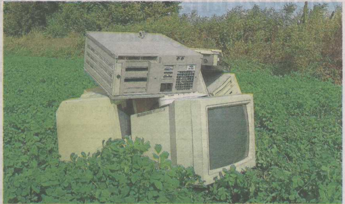
Imagen de los residuos que encuentran los voluntarios de la Asociación Fondo Natural / Let's Do It! Spain en sus acciones de limpieza medioambiental.

se generan toneladas de residuos que terminan en océanos, ríos, bosques... causando daños irreparables al entorno natural y poniendo en peligro la salud y el bienestar de las personas. La falta de control, gestión y acumulación de estos desechos ha propiciado que gran parte del mundo esté contaminado. Para revertir esta situación y convertir la responsabilidad medioambiental, individual y colectiva en un valor fundamental para el progreso de la sociedad se puede empezar con pequeños gestos, pero muy significativos, como es la participación en el Día Mundial de la Limpieza, una gran oportunidad para sensibilizar a la sociedad y que puede servir para iniciar un cambio cultural que ayude realmente a resolver el pro-